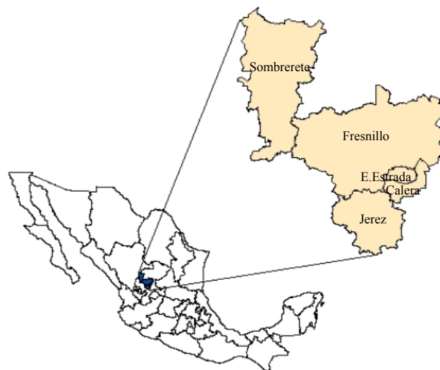
Figura 1. Ubicación de los municipios productores de durazno de temporal del estado de Zacatecas, México.

The study was conducted in peach region of the State of Zacatecas, Mexico, which is located between 102° 30' 00" and 103° 52' 12" west longitude and 22° 30' 00" and 24° 00' 00" north latitude and includes the municipalities of Sombrerete, Calera, Jerez, Fresnillo and Enrique Estrada (Figure 1).